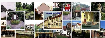
Létavértesi Hírek a facebook oldalon: