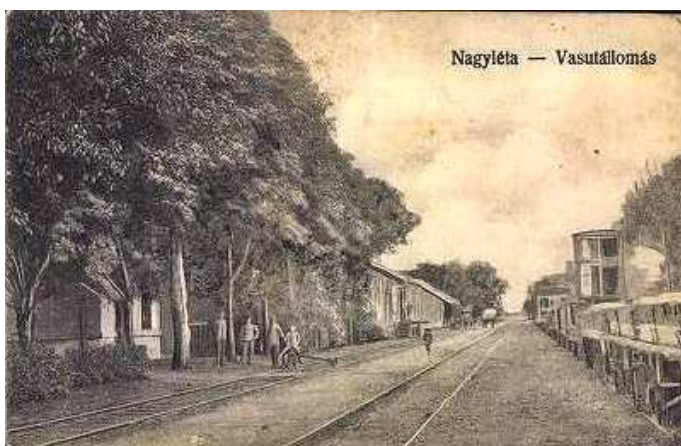
Nagyléta – Vértes vasútállomás látképe