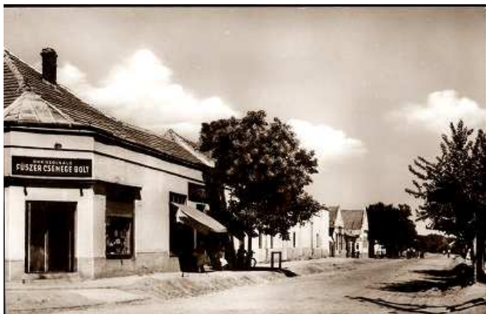
Nagyléta főtere az Önkiszolgáló bolttal