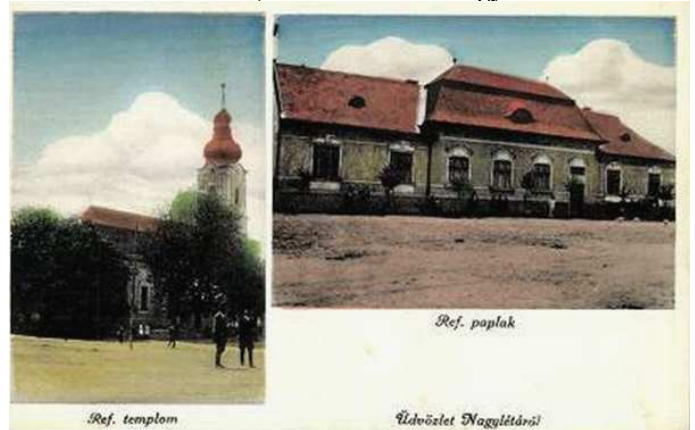
Nagylétai református templom és parókia