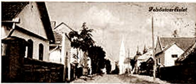
Felső, mai Irinyi utca