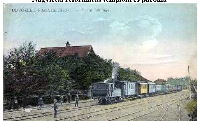
Nagyléta – Vértes vasútállomás látképe