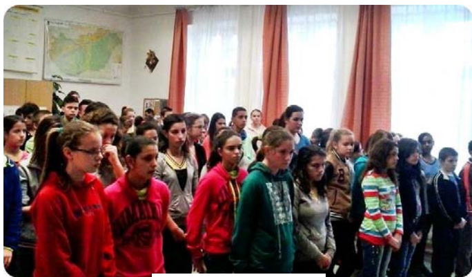
Gyülekezés a szavalásra

Január 22 -én , a Magyar Kultúra Napján, iskolánk felső tagozatos diákjaival együtt csatlakoztunk az „Együtt szaval a nemzet” felhíváshoz, annak tiszteletére, hogy Kölcsey Ferenc 1823-ban ezen a napon tisztázta le Csekén a Himnusz kéziratát.